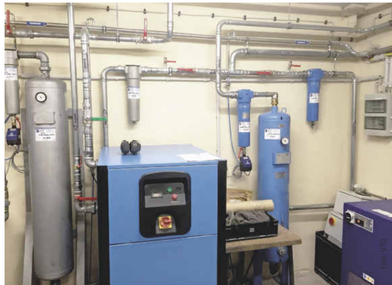
Die Druckluftaufbereitung – Vier moderne Kompressoren erzeugen gemeinsam mit den Stickstoffgeneratoren flexibel bis zu 100\text{ m}^3 Stickstoff pro Stunde.

Zum Verlöten von bedrahteten Bauteilen wie z. B. Steckverbindern und Leistungsspulen auf den Leiterplatten wird im Unternehmen das Wellenlöt- bzw. Selektivlöt-Verfahren eingesetzt. Bis vor kurzem wurde für die THT-Bestückung mit offenen Wellenlötanlagen gearbeitet. Selbst die Verwendung einer sogenannten Haube, unter der