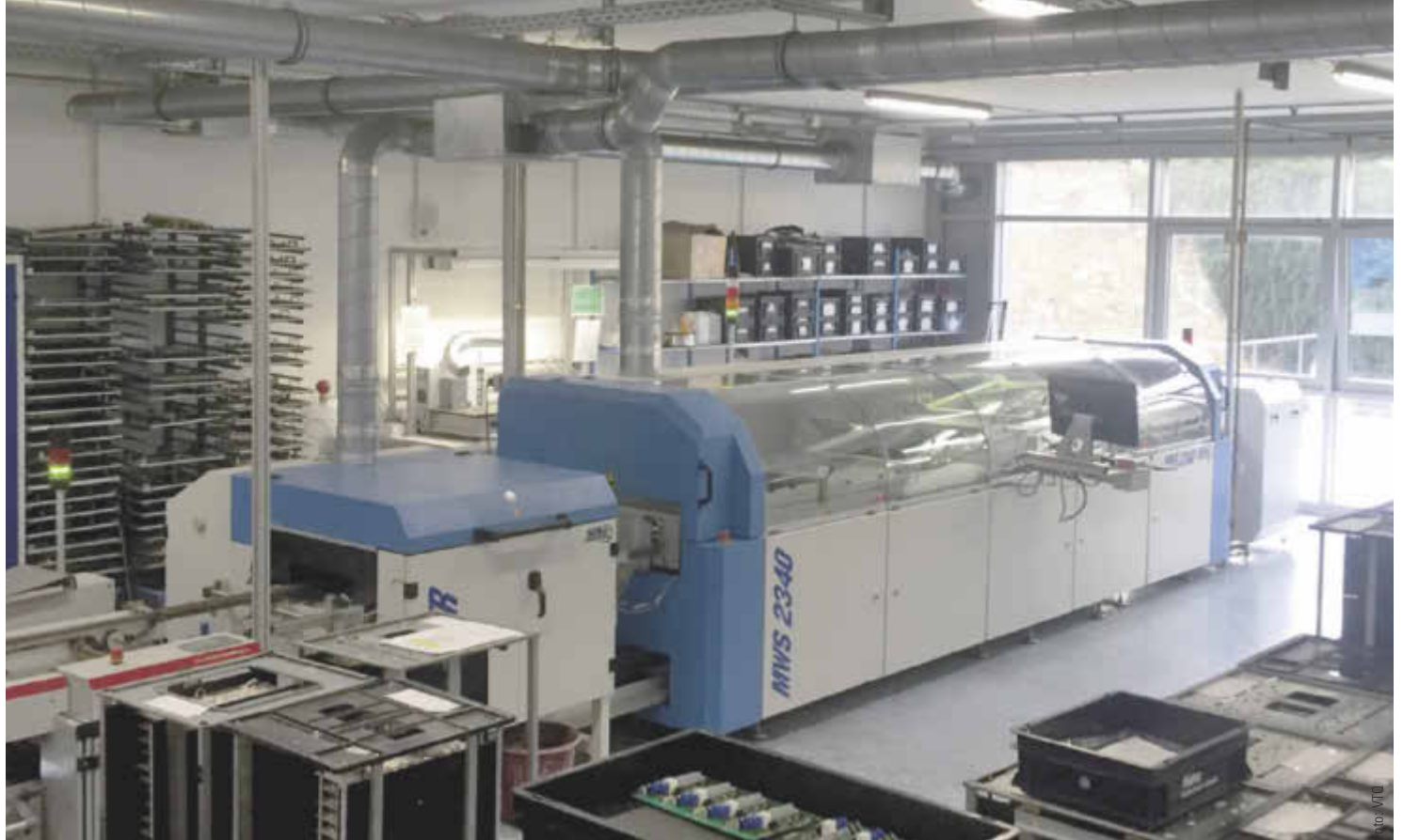
Die Produktionshalle mit Wellenlötanlage.