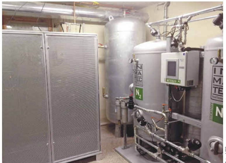
Einer der beiden PN 2250 Stickstoffgeneratoren von Inmatec (rechts) mit Wasserstoffkatalysator NKat 060 im Schrank (links).